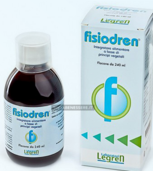
flacone da 250 ml

Diluire 20-30 ml in 1 litro d'acqua da bere durante tutta la giornata.